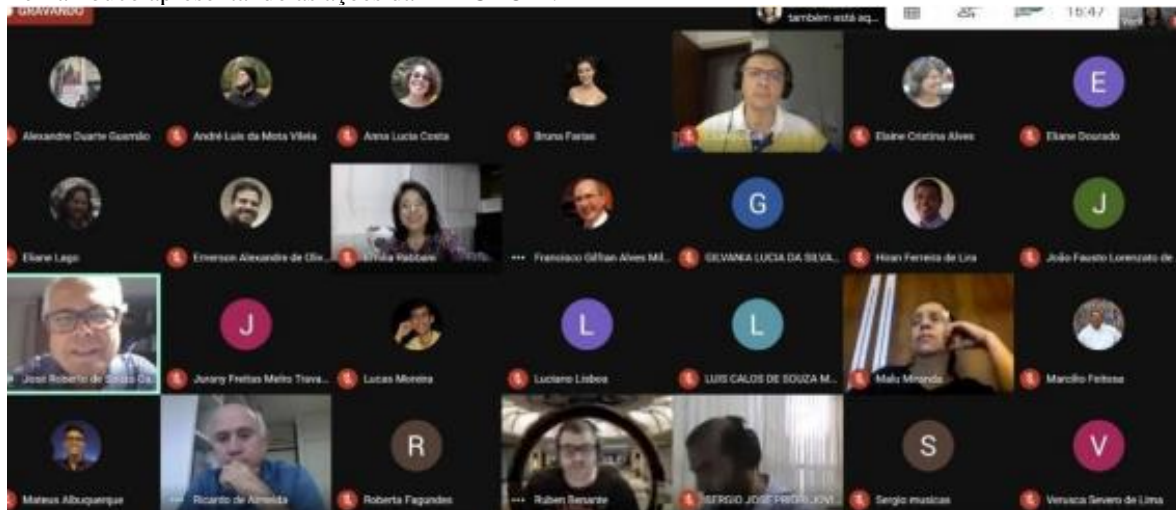
Figura 2 – Reuniões de planejamento estratégico com múltiplos setores da Escola Politécnica de Pernambuco apresentando as ações da ARI@POLI.

estes trabalhem juntos, visando o desenvolvimento de ações sinérgicas que potencializem os efeitos da internacionalização na Escola Politécnica de Pernambuco (POLI).