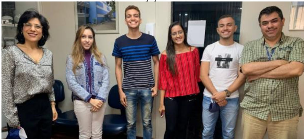
Figura 4 – Equipe ARI@POLI.

acompanhamento se mostraram essenciais para o sucesso na execução e acompanhamento das ações propostas.