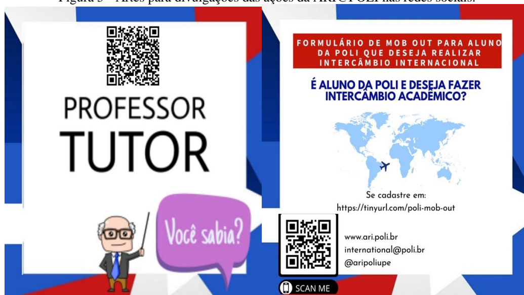
Figura 5 - Artes para divulgações das ações da ARI@POLI nas redes sociais.