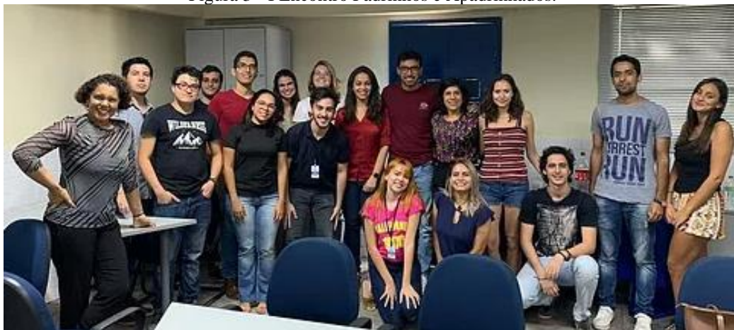
Figura 3 - I Encontro Padrinhos e Apadrinhados.

Pernambuco” ambos registrados na CSEC. O projeto de extensão foi aprovado com bolsa PDTE/POLI 2020 e desenvolvido durante o ano de 2020 e apesar de ter tido que ser adaptado devido a Pandemia e a suspensão da mobilidade IN pela UPE, teve como alguns de seus resultados o desenvolvimento de fluxogramas, atualização do guia para estudantes estrangeiros, estruturação de matérias para o site novo (ari.poli.br) e antigo (ARI@POLI, 2021a) e vídeos de curta duração (em inglês e português) que foram divulgados no canal de YouTube da ARI@POLI (2021b) que serviram para aprimorar e ampliar a comunicação com a comunidade interna e externa.